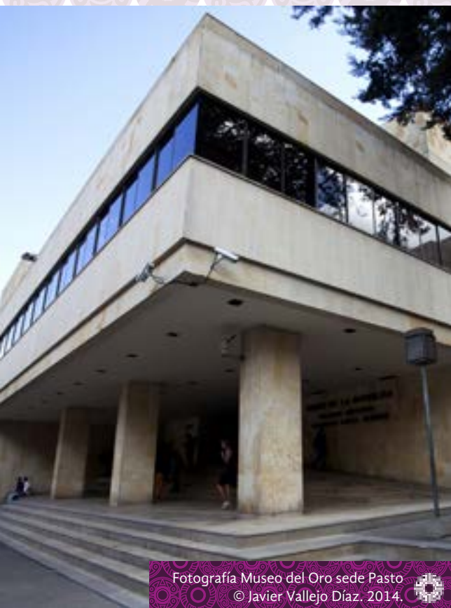
Fotografía Museo del Oro sede Pasto © Javier Vallejo Díaz. 2014.

Los demás objetos que se encuentran en la sala del Museo del Oro, están bajo la misma situación, es decir que están exhibidos acompañados de un pequeño texto y cuando hay visitantes, son los guías quienes comentan algunos aspectos históricos de los artefactos, lo cual evidencia que es un sistema de exhibición tradicional que no tiene en cuenta nuevos procesos educativos y de públicos que dinamicen la asimilación de estos saberes en los contextos actuales.