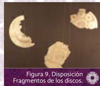
Figura 9. Disposición Fragmentos de los discos.

El resto de objetos culturales se sigue exhibiendo a través de la sala de exposición donde se encuentran cinco discos y cuatro fragmentos de los giratorios protopastos y como se puede observar en las fotografías, no todos se hallan en el mejor estado, razón por la cual disminuye la posibilidad de que el público los observe en su plenitud. (Véase figuras 5,6,7,8,9,10,11 y 12).