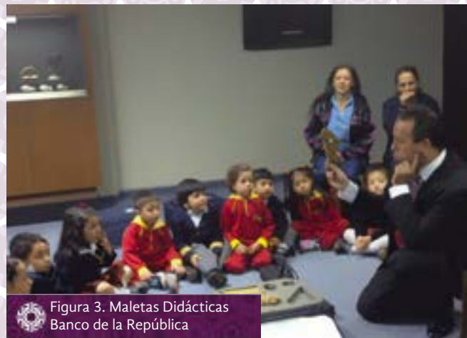
Figura 3. Maletas Didácticas Banco de la República

El Coordinador del Museo también expuso en una de las entrevistas, que los procesos más usados son las visitas a la sala permanente, las exposiciones itinerantes que llegan programadas desde Bogotá y los vídeos documentales que permiten hacer una didáctica de la historia (Testimonio, 2013). Entonces, se puede decir, que si bien los procesos educativos y de públicos no son del todo tradicionales, tampoco son totalmente innovadores considerando el patrimonio que resguardan en este lugar, por lo que podrían mejorarse haciendo uso de nuevas tecnologías.