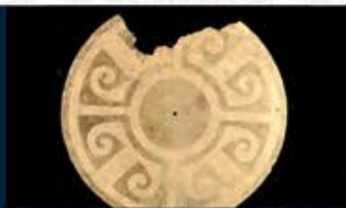
Imagen: Disco Giratorio Protopasto. Luis Ponce.