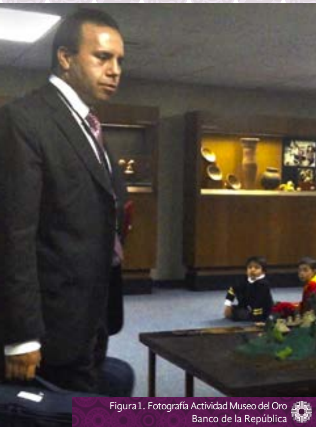
Figura 1. Fotografía Actividad Museo del Oro Banco de la República