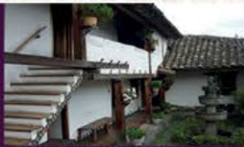
Imagen: Casona de Taminango.