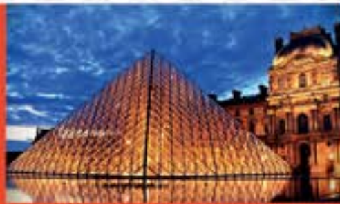
Imagen: Museo Louvre/Paris. www.louvre.fr/en