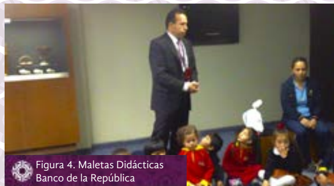
Figura 4. Maletas Didácticas Banco de la República