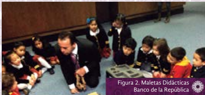
Figura 2. Maletas Didácticas Banco de la República