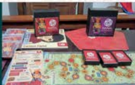
Imagen: Unida Museográfica.