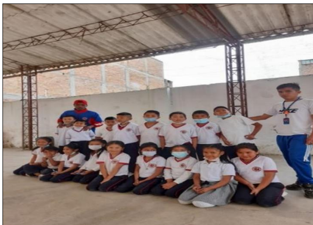
Imagen del grado tercero de la I.E.M. Santa Teresita, Sede Santo Tomás Catambuco.

Nota. Fotografía por Eyder Adrián López Guerrero. Octubre 8 de 2022.