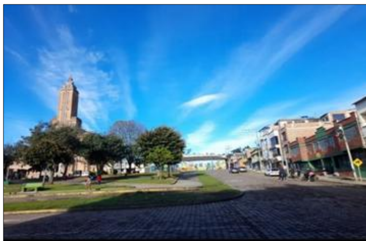
Imagen I.E.M. Santa Teresita, Sede Santo Tomás Catambuco.

Nota. Octubre 8 del 2022.