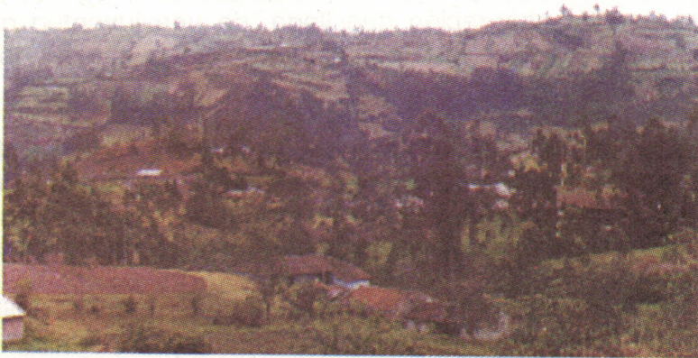
Chaguaipe la tierra que vio nacer a un campeón