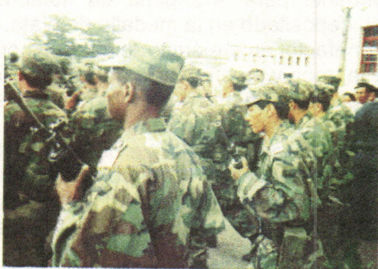
Batallón José María Cabal en la ciudad de Ipiales