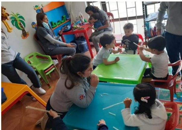
Figura 11. Actividad mi flauta mágica