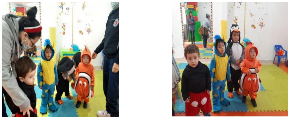
Figura 16. Actividad improvisando ando

El objetivo de esta actividad era permitirle al niño desarrollar juegos simbólicos donde ellos juegan hacer diferentes protagonistas, con su imaginación creando situaciones en las que ellos adquieran ciertos roles e incluso su atención, es por esto que en la parte asertiva el aceptarse y valorarse, respetando a los demás.