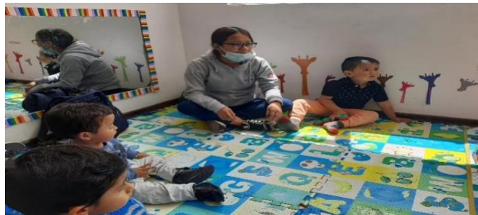
Figura 6. Actividad las palabras locas

Esta actividad trae grandes beneficios para su aprendizaje, por ello, desde esta investigación se les permite aprovechar al máximo del tiempo para para que el niño conozca sus habilidades y cualidades para que sepa desenvolverse.