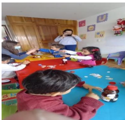
Figura 18. Actividad mi instrumento creo yo para cantar música con amor.

Estas actividades son importantes desarrollarlas en los niños desde las primeras edades ya que les sirve como base para el correcto desarrollo en dicción y por ende de comunicación, por medio de cantos en este caso por medio e laleos les permitimos a los niños y niñas.