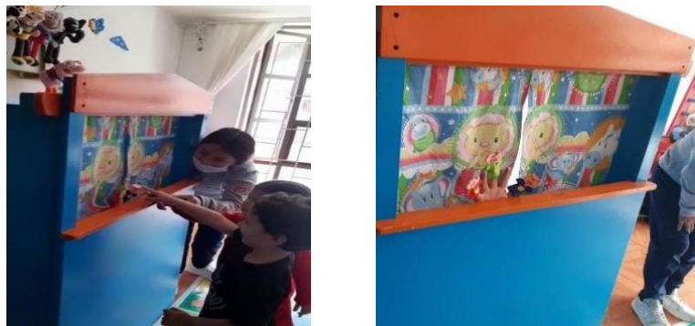
Figura 2. Actividad los títeres cantores

Es importante enfatizar que la actividad desarrollada, permitió que los niños estuvieran atentos degustando del espectáculo. La actividad consintió en que los niños demostraran su curiosidad, atención, concentración, se cumplió con El objetivo propuesto ya que fue una herramienta de motivación para que los niños pasen un momento divertido y de fantasía.