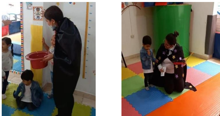
Figura 13. Actividad el Show de las palabras amables

Cabe destacar que las actividades desarrolladas se apoyaron desde un conocimiento previo en los niños y niñas, indicando que son capaces de dar un buen resultado a lo desarrollado en un en contexto como lo es el Gimnasio; los niños desde muy pequeños, son participativos y aprenden de conversaciones o diálogos y logran un buen resultado.