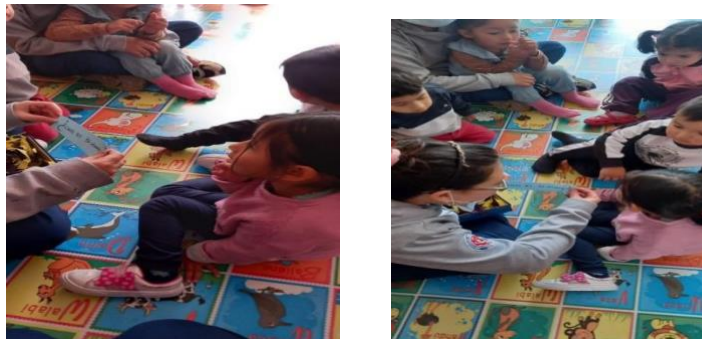
Figura 4. Actividad Mis diversas conversaciones

manejan la memoria y la percepción, capacidades que se dan de forma espontánea, ellos, absorben muchos aprendizajes que si son significativos para ellos permanecerán siempre en su memoria.