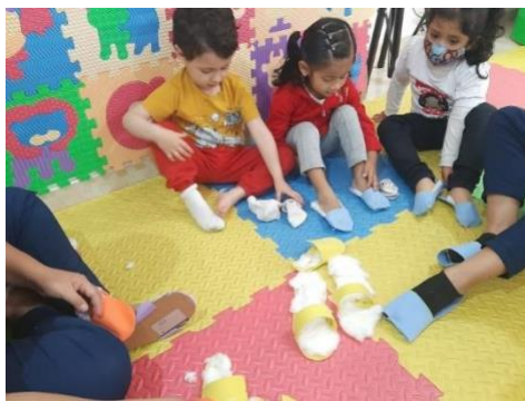
Figura 8. Los zapatos de algodón

Mi canción preferida: Por tal razón Vygotsky (1979) explica como las personas cercanas física y afectivamente a los niños, son quienes los conducen a avanzar en el aprendizaje de nuevos significantes y como esta relación adquiere una característica transferencial, en la medida en que incentiva el desarrollo cognitivo a partir del traspaso de conocimientos, capacidades y estrategias de quienes la poseen (padres) a quienes la van a poseer (hijos).