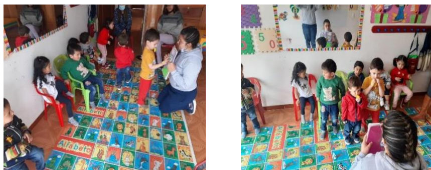
Figura 14. Actividad no quiero ser Igor

Se tuvo como objetivo lograr que a los niños les desaparecieran algunos temores al momento de comunicarse, como, por ejemplo: pánico, vergüenza, timidez entre otras y fue satisfactorio para las investigadoras ya que en otras actividades después de haber contado este cuento se notó que los niños estaban más participativos y con mucha más confianza.