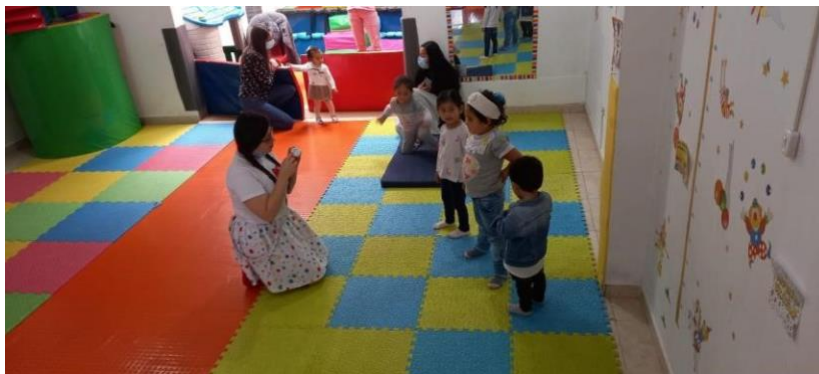
Figura 15. Actividad boquita clarita

Para esta subcategoría de estudio, se desarrolló una actividad llamada “boquita clarita”, las maestras investigadoras llevaron a cabo una dinámica para realizar con los pequeños, cada uno de ellos, debía mirarse a un espejo del gimnasio y hacer lo que las maestras hacían, esto con el fin de que los niños masajearan sus labios con la explicación de que con la vaselina la boquita estaba lista para poder pronunciar bien las palabras << pofe poque me aplica billo>> es porque a través del brillito tú vas a poder hablar claramente, y si no les aplico el brillo es porque no están hablando correctamente, << aah ya pofe>>, aquí se destacó la importancia que los niños y niñas tuvieron al mejorar una buena interacción hacia ellos mismos, y maestras.