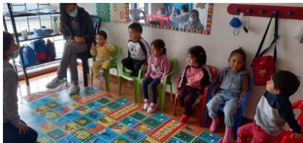
Figura 5. Actividad El cuento sin acabar

Es importante recalcar que los cuentos sirven como entretenimiento para los niños y niñas, aportan valores y ayudan al desarrollo de sus emociones ya que es una herramienta muy valiosa para ellos y en su desarrollo.