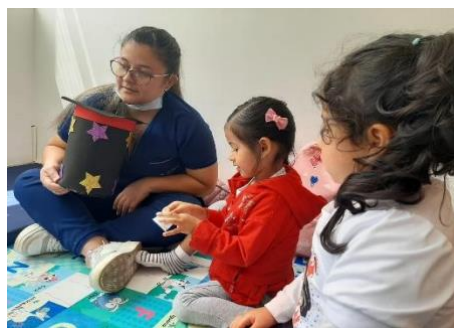
Figura 17. Actividad la escala musical

Mi instrumento creo yo para cantar música con amor: Según Hensy (1984), lo esencial de un niño de edad temprana es que sus cuidadores reconozcan el órgano auditivo como fuente rica y variada de sensaciones; generar desde entonces, un ambiente rodeado de canciones, sonoridad, beneficia en múltiples campos al niño.