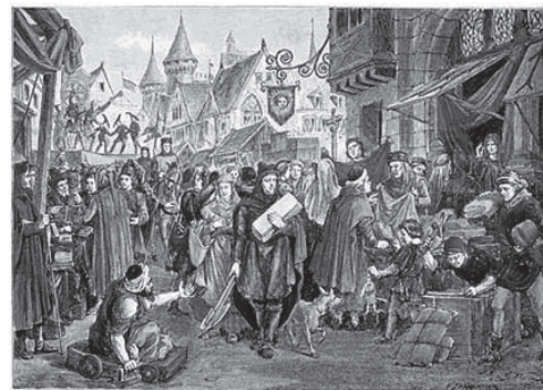
Comercio en la edad media.

Con el transcurso del tiempo el concepto de marca se fue transformando, la industrialización, el crecimiento del sector empresarial, la fuerza de los medios de comunicación y los nuevos estilos de vida, generaron un enorme cambio en la vida de las marcas, pasando de un simple signo material a un valor intangible presente en terrenos que iban más allá del producto.