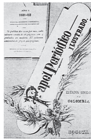
Carátula del papel periódico ilustrado.

En tal sentido, para comprender la incidencia de la marca en el entorno empresarial, se debe reconocer de manera general la importancia del diseño gráfico en el país y por consiguiente en la región nariñense. Se dice que las primeras prácticas del diseño gráfico inician a finales del siglo XIX con la diagramación del “Papel periódico ilustrado”, un medio impreso que generó importantes movimientos culturales; sumado a ello el surgimiento de las tipografías que además de su importante labor como emisoras del conocimiento y los sucesos, también buscaron generar sus propias publicaciones, aportando de esta manera a darle forma a este nuevo lenguaje. El surgimiento de medios impresos importantes como El Tiempo y la revista Cromos a inicios del siglo XX, también marcaron una pauta importante ya que comenzaron a preocuparse por la apariencia de sus productos y la comodidad de sus lectores, convirtiéndose entonces el