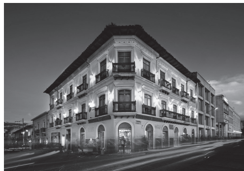
Ponce, L. (2009). Casa Navarrete.

Al respecto es indispensable exponer los criterios que condujeron a la selección de dichas empresas y por lo tanto sus marcas. En primera medida, y como se menciona, la empresa debía generar sus propios productos contando con que su fabricación se debía desarrollar en el municipio o en sus alrededores inmediatos. Después de haber definido esto, el cuestionamiento giró alrededor del producto, ¿qué naturaleza debía tener el artículo?.