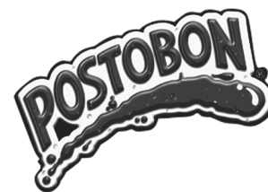
Logotipo de Postobón.

Pese a las limitaciones a nivel comercial, existió una gran voluntad de integración con los diferentes mercados del norte, bajo una oferta de artesanías, trigo, madera, cueros y papa. También se iniciaron cambios