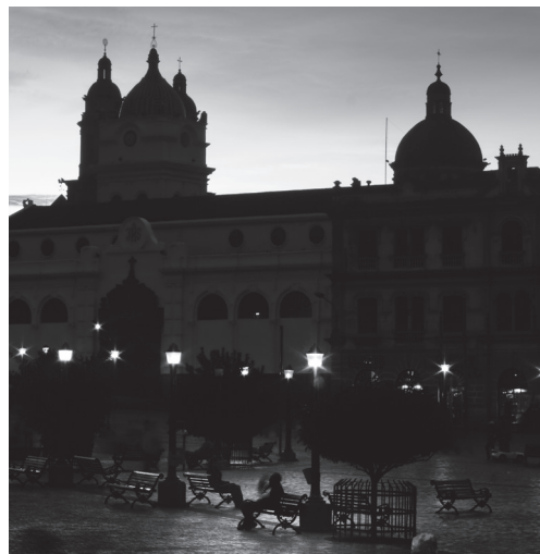
Ponce, L. (2008). Plaza de Nariño.