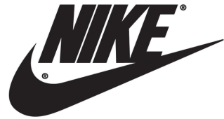
Imagotipo Marca Nike. (2010). Archivo investigación.