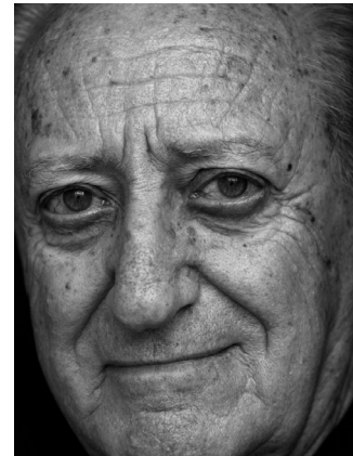
Joan Costa. Recuperado de: http://www.geditorialdesign.com/html/joancosta.html .

Cabe agregar que la anterior configuración por si sola no funciona, existen características indispensables que hacen de esta importante pieza corporativa un elemento eficaz. Entre ellas podemos encontrar los colores corporativos los cuales se encargan de dar visibilidad a la marca, invocando estética y emociones sobre la misma y generando mayor pregnancia y fuerza óptica. Son considerados símbolos visuales que añaden