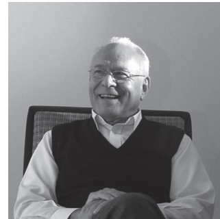
Norberto Chaves. Recuperado de: http://www.estudiologos.com/blog/el-diseno-hoy-segun-el-experto-norberto-chaves/ .

Se puede decir entonces que el nombre es la base sobre la cual se fundamenta la marca gráfica, naciendo de esta manera una configuración que depende de las características de su construcción. En primera medida se encuentra el logotipo, parte escrita del nombre, y también referida como firma. Usualmente es representada por tipografía, ya sea en altas o bajas, puede estar constituido por uno o varios tipos de letra, usando los colores corporativos o en blanco y negro, en dos o tres dimensiones, en positivo o en negativo, constituyendo así la versión gráfica estable del nombre.