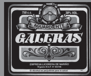
Etiqueta Aguardiente Galeras.