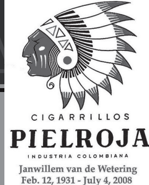
Etiqueta Cigarrillos Pielroja.