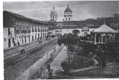
Antigua Catedral de Pasto, cuyo demolición ha comenzado para levantar un templo moderno.

Las casas comerciales más reconocidas para los años cincuenta corresponden a las firmas: Casa Mettler, Luís Escrucería e hijos, Sager y Cía., Francisco Haeblerlin, Restrepo y Cía., entre otras, las cuales se dedicaban a la importación de diferentes elementos que difícilmente se conseguían en la región como: electrodomésticos, telas, elementos de ferretería y construcción, entre otros. Dichas casas no tenían como fin generar sus propios productos, ya que la condición industrial de la ciudad en el momento no permitía que estas organizaciones sean más ambiciosas respecto al manejo