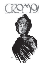
Primera portada de Cromos, 1916.