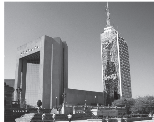
Empresa Coca-Cola.