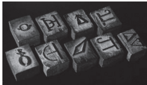
Marcas con las que se distinguían los caballos en el siglo XIX.