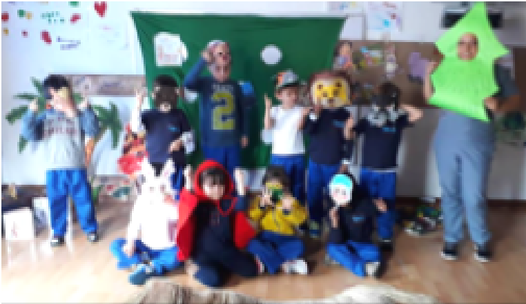
• Figura 1. Comunicación oral.