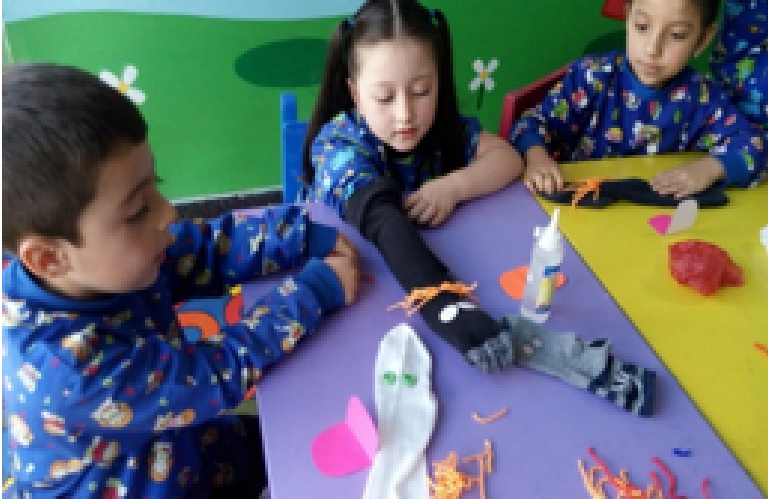
• Figura 1. Expresión artística.