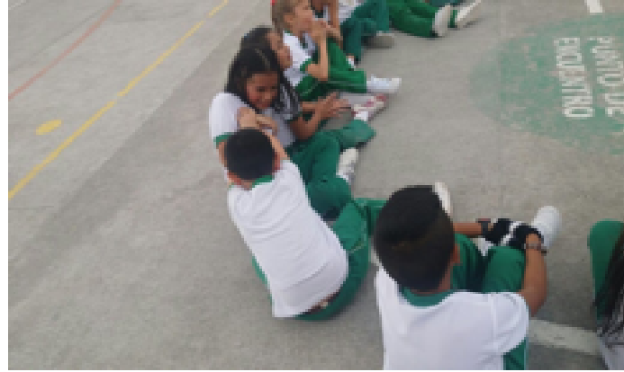
• Figura 2. "el toro en el corral".

En el juego llamado "el oso", descrito en el plan de clase número cuatro (4), (ver figura 3), se pudo vivenciar el cumplimiento de los roles los dos personajes, el oso realizó gestos cuando lo tocaban poniendo alerta al guardián, y el atraparlo de parte del mismo para ganar puntos en el juego; sin embargo,