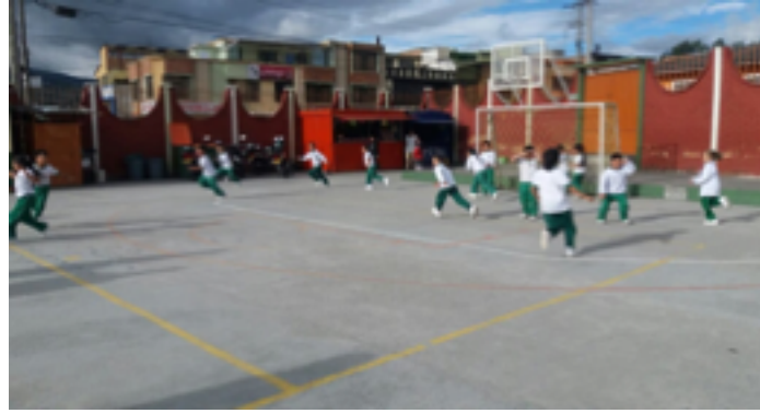
• Figura 1. "Los cañoneros".

En el desarrollo de las actividades inmersas en los planes de clase se observaron diferentes conductas, las cuales estuvieron relacionadas con agresiones físicas y verbales. Esto se determinó, por ejemplo, en la actividad "los cañoneros", descrita en el plan de clase número uno (1), (ver figura 1).