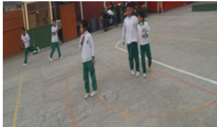
• Figura 3. "el oso".