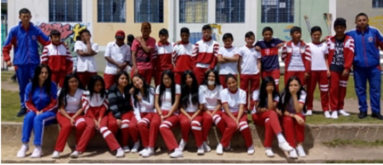
• Figura 1. Estudiantes séptimo grado.