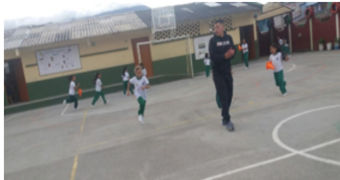
• Figura 5. "El come cocos".

Entonces cuando la comunicación entre los estudiantes no es efectiva, es ahí donde aparecen los inconvenientes para la realización y el cumplimiento de los roles dentro de una actividad en específico. Por ende, es importante que exista esa comunicación entre los educandos, y de esta manera no existan las discusiones, ni inconvenientes a la hora de realizar las actividades planteadas.