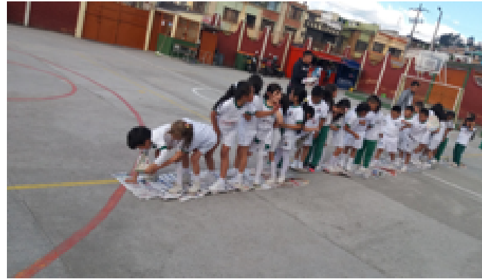
● Figura 6. “Las Pirañas”.

Otro de los hallazgos dentro de las conductas sociales fue la motivación, que, según Herrera, Ramírez, Roa, indican que la motivación: “es una de las claves explicativas más importantes de la conducta humana con respecto al porqué del comportamiento. Es decir, la motivación representa lo que originariamente determina que la persona inicie una acción (activación), se dirija hacia un objetivo (dirección) y persista en alcanzarlo (mantenimiento)” 6 (p.154). De acuerdo a lo mencionado, cabe resaltar que la motivación se manifestó a través de la técnica del taller educativo al aplicar el juego denominado “las pirañas”, que es un juego cooperativo que se basa en trasladarse de un lugar a otro utilizando únicamente hojas de periódico, como lo muestra la siguiente imagen: