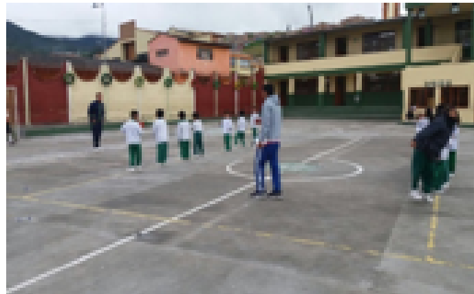
• Figura 4. "Día y noche".

Cabe resaltar que hubo buena comunicación entre los estudiantes al momento de realizar alguna actividad. El juego que más ayudo a percibir esto, fue "Día y noche" descrita en el plan de clase número uno (1), (ver figura 4).