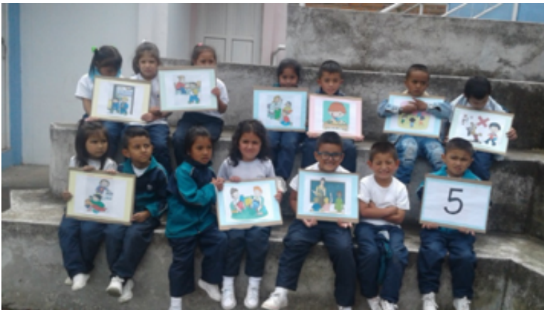
• Figura 1. Reconociendo normas en mi salón