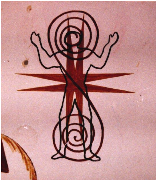
Figura 1. El «Churo Cósmico» según los actuales indígenas del Resguardo de Cumbal (Mural elaborado por los estudiantes del Colegio Técnico Agropecuario Etnopedagógico “Cumbe”).