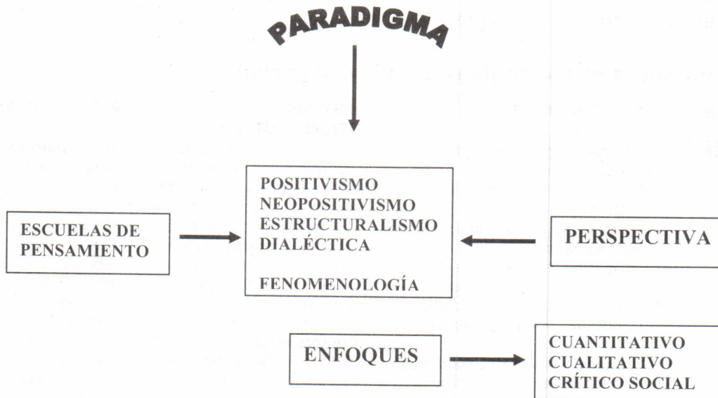
Figura 1. Estructura de Paradigma, Perspectiva y Enfoque de la Investigación

2.2.3 Enfoques de la investigación. Se entiende por enfoque a la posibilidad de focalizar, circunscribir la mirada con un énfasis; por lo tanto, toda investigación se puede focalizar según las propiedades cualitativas, cuantitativas o críticas.